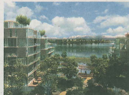
■住宅單位以低密度為主，大部分單位可遠眺風景優美的菲沙河。發展商模擬圖

環保綠化為主題，區內住戶可以享受多樣化的娛樂、運動及消費設施。住戶停車場會設在地庫。居民可以步行到附近購物，也可以乘屋苑提供的穿梭巴士，來往烈市中心。